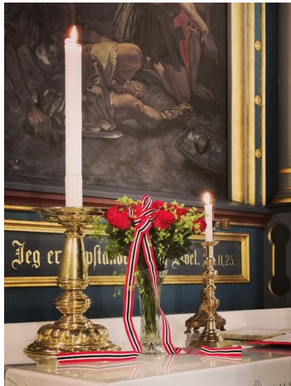
Alteret i Vestby kirke er pyntet og klart til digital 17.mai-gudstjeneste